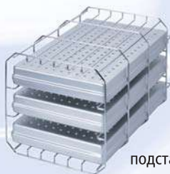
подставка типа А (повёрнутая на 90град.) на 3 стандартные кассеты