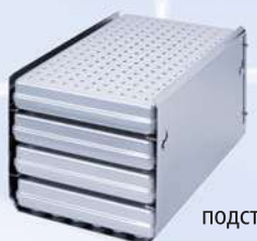
подставка типа В на 4 стандартных кассеты