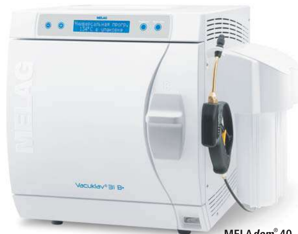
MELAdem® 40 установленный на автоклаве Vacuklav® 31 B+

Управление этими автоклавами удобно и безопасно. И дизайн полностью соответствует этим задачам. Основное внимание уделяется эффективности использования. Например, большой дверной запор не просто особенность дизайна, он обеспечивает безопасность и удобство отпирания и запираания двери.