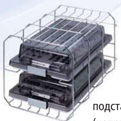
подставка типа В на 2 высокие кассеты (например для имплантологии)