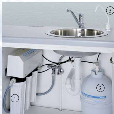
MELAdem ® 47 (1) в шкафчике в комплекте с накопительным баком (2) и краном (3)