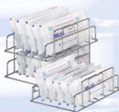
подставка для упакованных инструментов