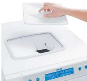
встроенный контейнер для воды

Большое, встроенное, воронкообразное отверстие для залива дистиллированной или деминерализованной воды в водяной контейнер обеспечивает удобное его наполнение в моделях Vacuklav® 31 B+ и Vacuklav® 23 B+. В качестве альтернативы, оба автоклава могут снабжаться водой из внешнего резервуара или подключаться к устройству водоподготовки.