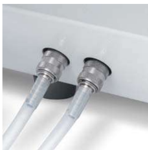
слив отработанной воды

Большое, встроенное, воронкообразное отверстие для залива дистиллированной или деминерализованной воды в водяной контейнер обеспечивает удобное его наполнение в моделях Vacuklav® 31 B+ и Vacuklav® 23 B+. В качестве альтернативы, оба автоклава могут снабжаться водой из внешнего резервуара или подключаться к устройству водоподготовки.