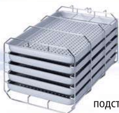
подставка типа А на 5 лотков

Автоклавы всегда поставляются в комплекте с держателями лотков или кассет, включёнными в стоимость, обычно это модель "А" (рассчитанная на 5 лотков или 3 стандартные кассеты). При размещении заказа, пожалуйста, уточняйте, если вместо стандартной модели "А", вы предпочитаете получить, за ту же цену, модель "В", рассчитанную на 4 стандартных кассеты или модель "D" для двух высоких кассет, например кассет для имплантации или высоких стерилизационных контейнеров. Подставка для упакованных инструментов делает возможным вертикальную стерилизацию упакованных предметов для оптимальных результатов сушки.