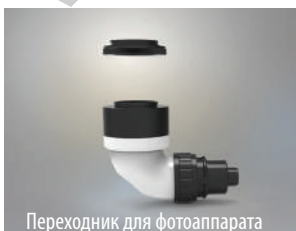
Переходник для фотоаппарата