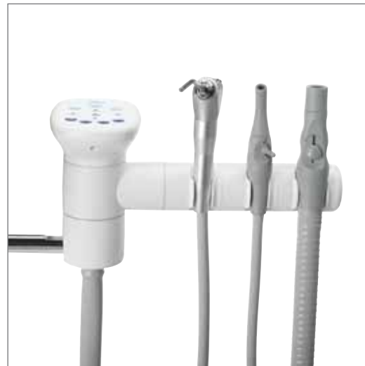
Отдельный трехпозиционный держатель показан с дополнительной сенсорной панелью и пистолетом.

Трехпозиционный держатель и телескопический кронштейн обеспечивают надлежащее положение вакуумных инструментов для удобного доступа к пациенту.