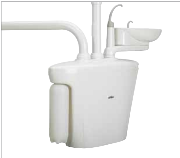
Бутылка автономной системы водоснабжения.

Фарфоровая плевательница поворачивается в удобное для пациента положение. Легко наполняемая бутылка объемом два литра обеспечивает постоянную подачу воды для проведения различных процедур. На центральном опорном блоке может быть размещено дополнительное оборудование, например отделители амальгамы и вакуумные системы.